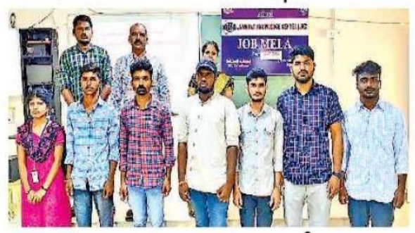
ఇంకుబేషన్ జాబ్[డైవ్కు ఎంపికైన డి(గీ విద్యార్థులు