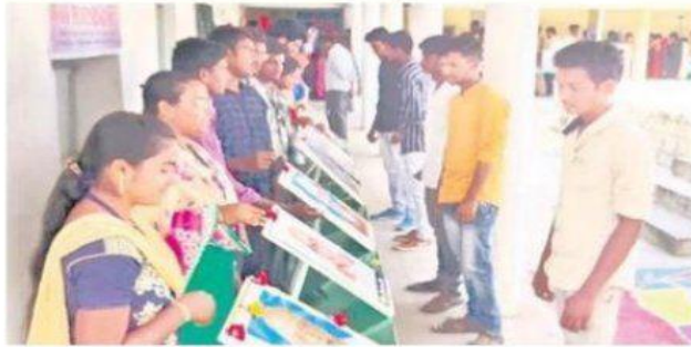
సమరయోధుల చిత్రపటాలను తిలకిస్తున్న విద్యార్థులు