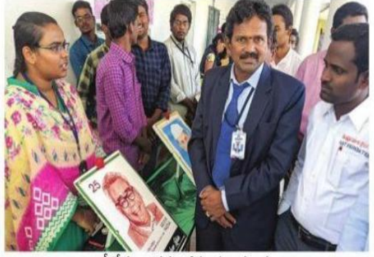
పీలేరు, జనవరి 24 ప్రభాతవార్త దేశాన్ని బానిసత్వ సంకెళ్ళనుండి విముక్తి కలిగించేందుకు ఎంతోమంది