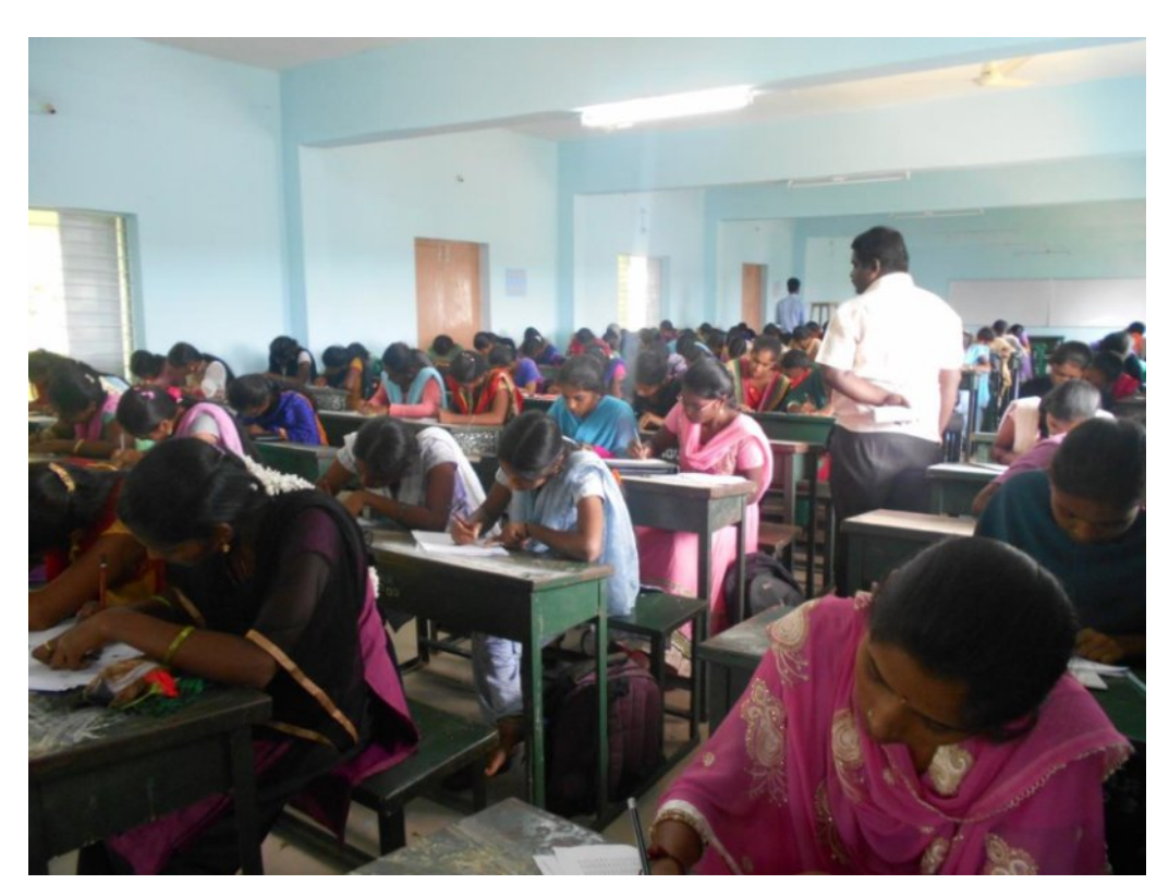
<u>Out of 150 , 38 Candidates were qualified in written Exam. Company HR Conducting the Interview.</u>

Total 150 Students have attended for the written exam.